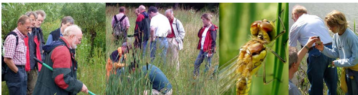
Bild 5: Gemeinsame Aktivitäten in der freien Natur – wie hier das Planktonfischen – verbinden vielfach Hobbymikroskopiker miteinander.

Autor: Wolfgang Bettighofer, Rutkamp 64, D-24111 Kiel, email: wolfgang.bettighofer@gmx.de