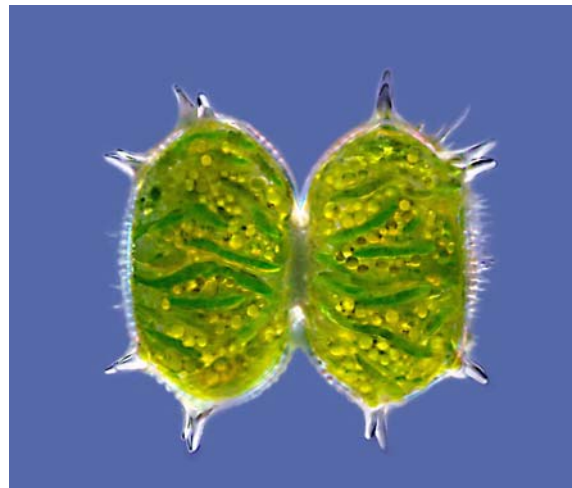
Bild 1: Xanthidium antilopaeum , eine Zieralge aus Moorgewässern. Der grüne Chloroplast ist windradähnlich gefaltet.

Abbildung 1 zeigt die Zieralge Xanthidium antilopaeum . Mein allgemeines Interesse an Biologie und Technik tat ein Ubriges, so dass ich bereits als Mittelstufenschüler rege mikroskopierte und DIE Zeitschrift für Mikro-Liebhaber, den MIKROKOSMOS, abonnierte und regelmäßig las. Durch sein breit gefächertes Spektrum machte mich der MIKROKOSMOS neben der vielschichtigen Kleinlebewelt mit Zellstrukturen von Tier- und Pflanzengewebe sowie der interessanten Farbenwelt der Kristalle im polarisierten Licht bekannt. Des Weiteren hatte ich in ihm ein sich ständig erweiterndes Lehrbuch der mikroskopischen Technik.