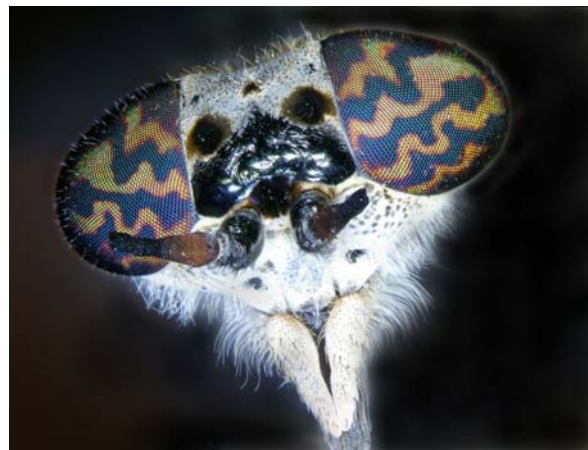
Bild 4: Kopf einer Pferdebremse, durch ein Stereomikroskop betrachtet.

Alle bisher genannten Anwendungsgebiete der Mikroskopie gehen davon aus, dass die Beobachtungsobjekte so dünn sind, dass das Licht durch sie hindurch scheinen kann. Ein einzelnes Objektiv erzeugt ein zweidimensionales Bild. Freunde der Mineralogie und der Entomologie (Insektenkunde) hingegen benötigen Mikroskope, die ähnlich dem Fernglas beiden Augen leicht unterschiedliche Blicke auf das Objekt ermöglichen und es damit dreidimensional zeigen. Abbildung 4 versucht, einen Eindruck dieser Dreidimensionalität zu erzeugen. Vom Kopf der Pferdebremse wurden viele Schichtaufnahmen hergestellt. Mit Hilfe eines Computerprogramms wurden alle scharfen Teile der Aufnahme-Serie zu einem Gesamtbild zusammengesetzt. So erklärt sich die enorme Schärfentiefe bei gleichzeitiger hoher Detailauflösung.